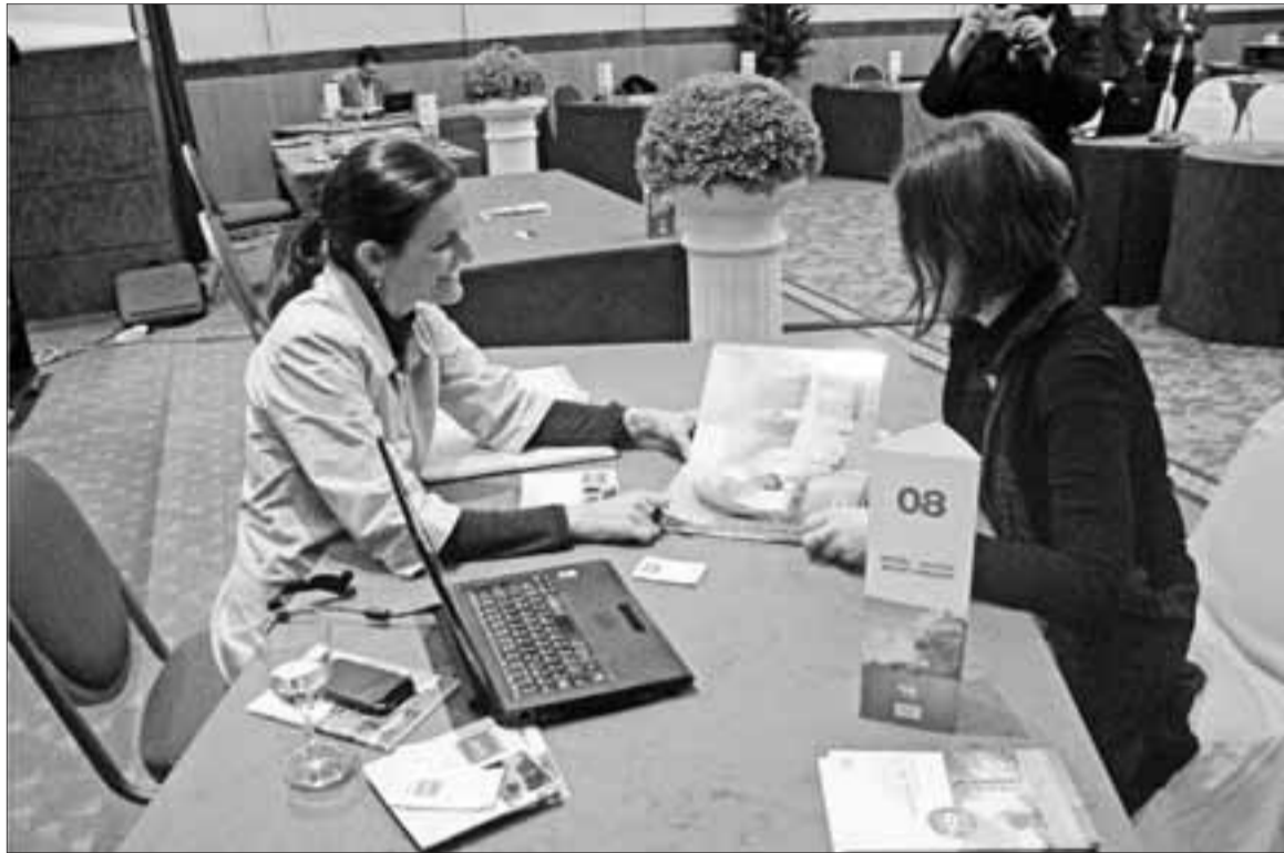
Al novembre del 2010 la comarca va participar a la fira turística World Travel Market de Londres.

Fax: 977343216. Email: reus@diaridetarragona.com