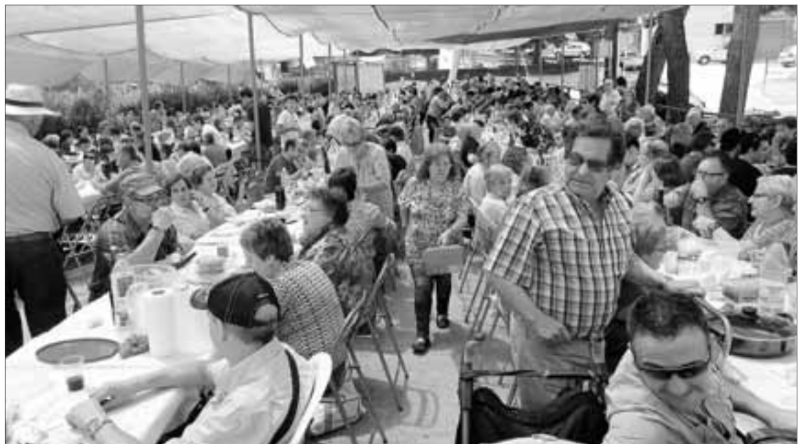
Els assistents van degustar el tradicional arròs amb conill i els cargols dolços i coents.

Per la seva banda, més de 50 estands oferien, dins la 26 edició de la Mostra d'Artesania, tot tipus de productes artesanals: embotits, formatges, dolços, salats, ceràmica o bijuteria.