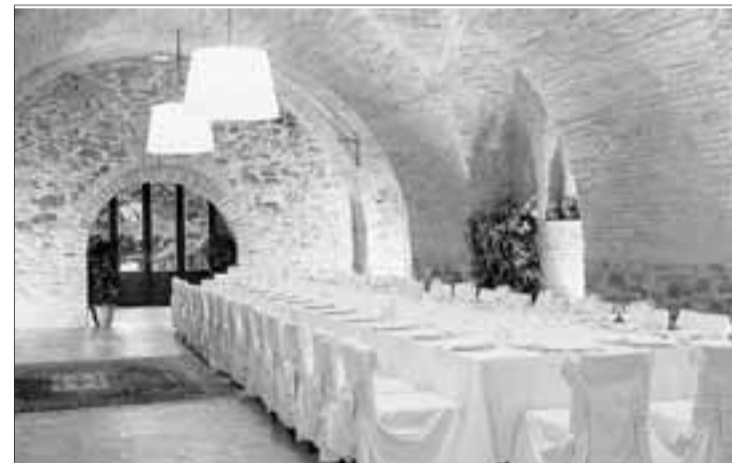
► Imatge del menjador d'Hotel-Hostal Sport.

Aquest dissabte la Torre de Fontaubella viurà la segona edició de la Cronoescalada Pujada a la Mola. Enguany la sortida serà a partir de les sis de la tarda des de la plaça de l'Església del poble. Aquesta prova, que es va celebrar amb un notable èxit per primera vegada l'any passat, té una distància total de 6.787 metres i un desnivell acumulat de 552 metres. Organitzen Fontaubella Fondistes, l'Ajuntament del poble i Tretzeesports.