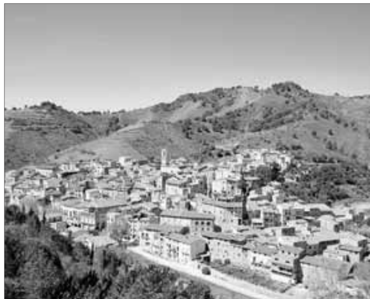
► Imatge de Porrera, municipi on cada estiu es fa el concurs 'Nasset, Nas, Nassot'.

Durant l'any s'organitzen diferents esdeveniments a les viles i pobles de la DOQ Priorat a l'entorn de la cultura del vi. En el cas de Porrera, a banda del 'Nasset, Nas, Nassot', també es porta a terme una mostra de vins força popular, el Tasta Porrera, que s'escau al novembre.