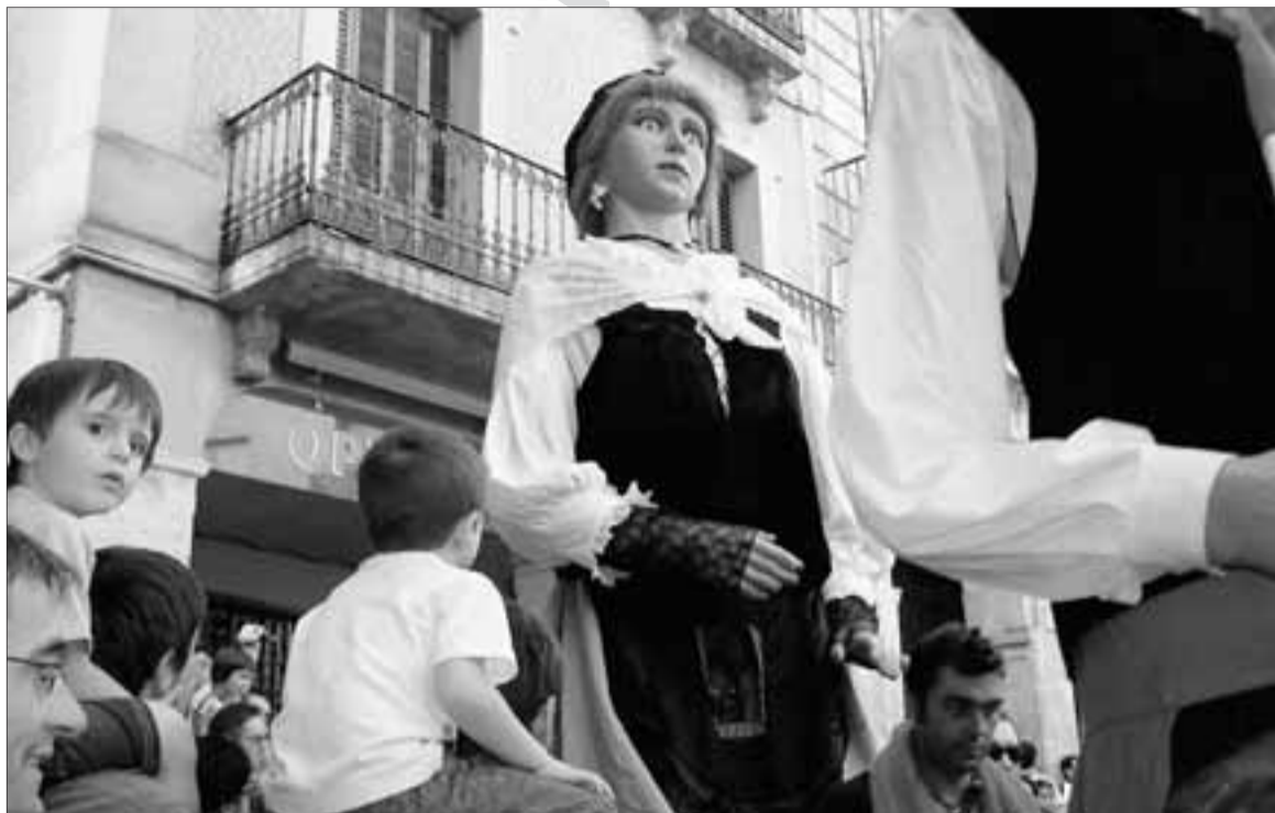
► Els gegants de Falset, uns dels protagonistes aquest cap de setmana de la Festa Major.

Fax: 977343216. Email: reus@diaridetarragona.com