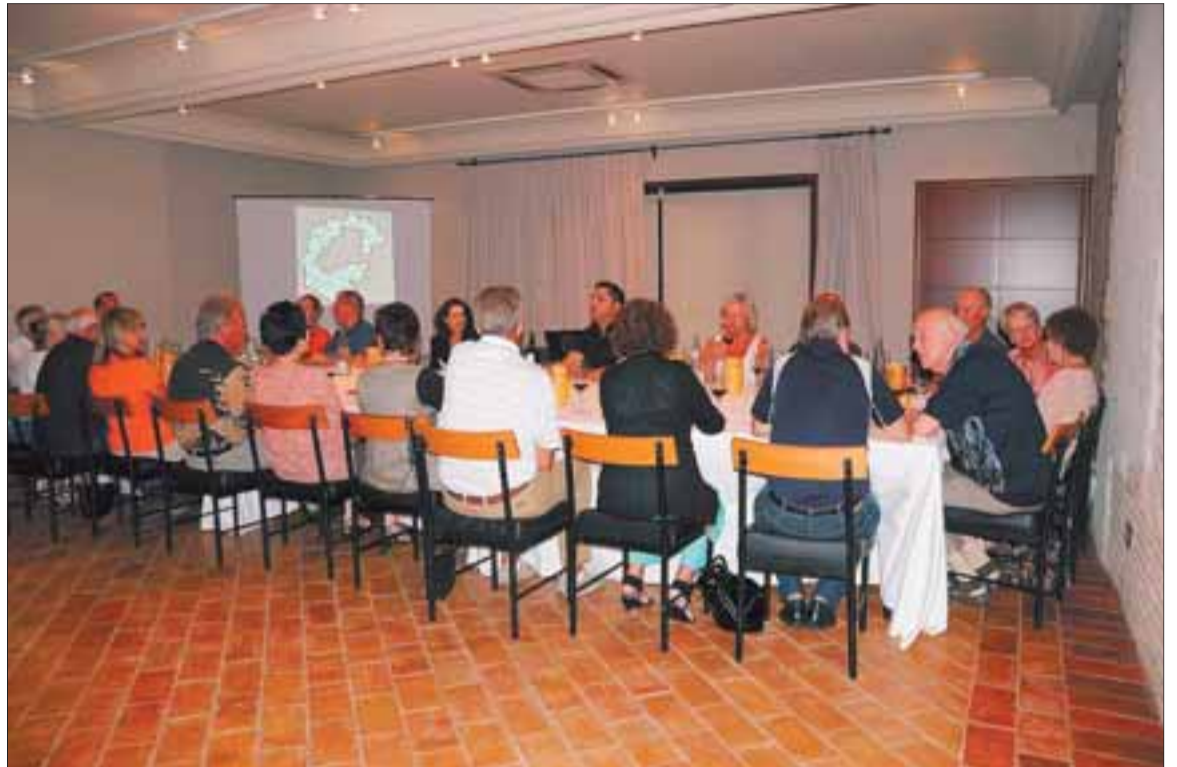
Un grup de noruecs, dilluns passat, durant un tast de vins a l'Hotel-Hostal Sport.

El dissabte que ve, 24 de setembre, tindrà lloc una sortida-taller entomològica per conèixer l'hàbitat, situació i curiositats de les formigues al Montsant, organitzada pel grup ecologista Gepec. El punt de trobada serà a les nou del matí a Margalef de Montsant i l'excursió durarà tot el dia. Per a més informació i inscripcions al telèfon 977 331142 o bé a l'adreça de correu electrònic secretaria@gepec.org.