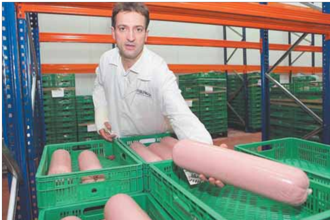
■ Schorn produce embutidos típicamente alemanes y los más tradicionales catalanes.

Asimismo, Schorn prevé recuperar la distribución capilar