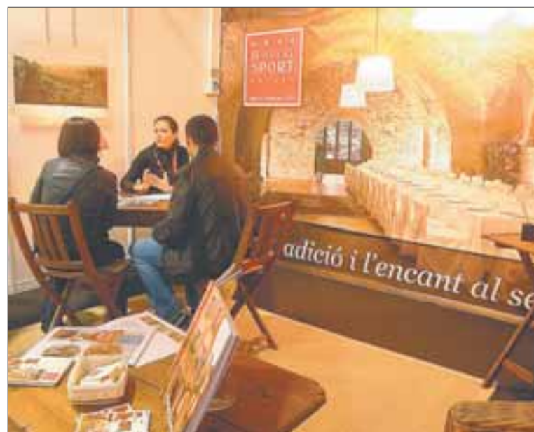
■ El Sport promueve las posibilidades del Priorat para el turismo de negocios a través de su participación en numerosas ferias.

Dentro de la acción promocional, esta mañana habrá una degustación de vinos de la DO Montsant. –R.V.